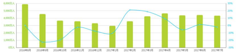
2016年8月至2017年7月中国网月度覆盖人数